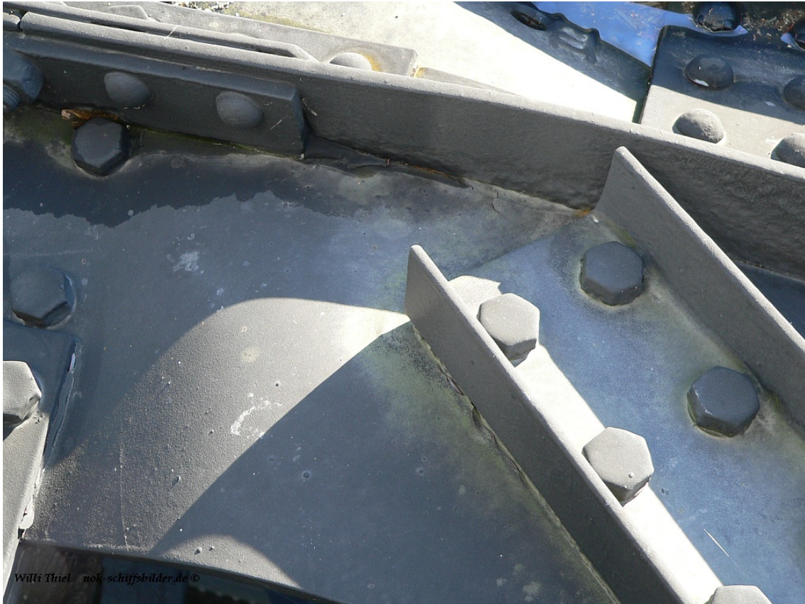
Leicht eingedrückter Bug der " CRYSTAL TOPAZ" nach Havarie mit Tor 1Nordkammer Schleuse am 4 Juli 2010